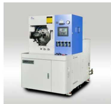
陽圧 SPS LABOX-GP シリーズ