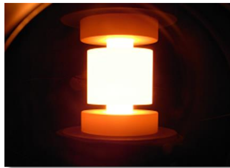
導電性セラミックス SL-400H シリーズ