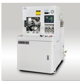
研究開発用途 LABOX シリーズ