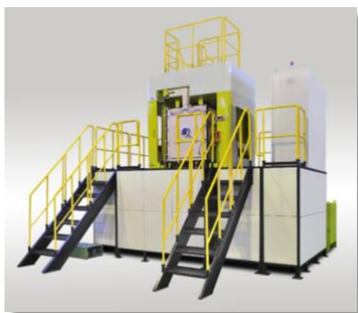
生産用途 JPX シリーズ